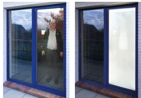
SICHTSCHUTZ CLEVERGLAS ISO als Sichtschutz auf Abruf.